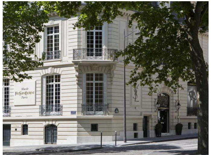
Façade du Musée Yves Saint Laurent Paris