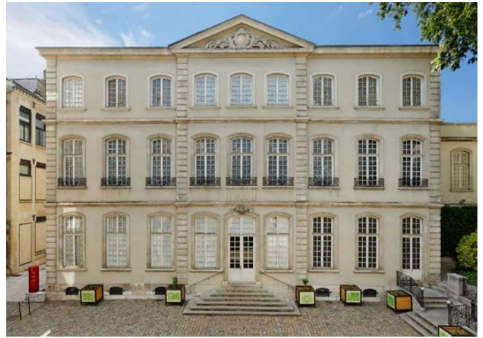
Façade du Musée des Tissus Lyon

Un pôle d'excellence, fondé sur les savoir-faire des entreprises textiles et de soie.