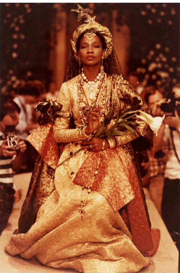
Yves Saint Laurent (1936-2008). Robe de mariée dite « Shakespeare ». Collection haute couture automne-hiver 1980.

Renaud, Brochier, Hurel et Sfate & Combier , pour les soyeux, mais aussi les convertisseurs et intermédiaires, les maisons Bucol, Abraham et Beaux-Valette , qui faisaient fabriquer les étoffes entre Rhône et Saône.