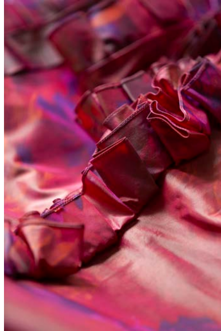
Yves Saint Laurent (1936-2008). Ensemble (détail). Collection haute couture printemps-été 2000.

La visite se poursuit avec l'extraordinaire robe de mariée issue de la collection automne-hiver 1980 dans laquelle Yves Saint Laurent rend hommage aux poètes qu'il admire et qui l'inspirent. Ce modèle, dit « Shakespeare », paré de bijoux, a été confectionné grâce à la collaboration de cinq maisons lyonnaises : Abraham, Bianchini-Férier, Bucol, Hurel et Mérieux . Cette partie rend compte du travail considérable qu'aura nécessité cette création unique.