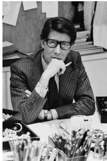
Yves Saint Laurent à son bureau, studio du 5 avenue Marceau, Paris, 1986.

Le Musée Yves Saint Laurent Paris expose l'œuvre du couturier dans le lieu historique de son ancienne maison de couture. Il occupe en effet l'hôtel particulier historique du 5 avenue Marceau où naquirent durant près de 30 ans, de 1974 à 2002, les créations d'Yves Saint Laurent. Sur plus de 450 m 2 , une présentation sans cesse renouvelée, alternant parcours rétrospectif et expositions temporaires thématiques, rend compte de la richesse du patrimoine unique appartenant à la Fondation Pierre Bergé - Yves Saint Laurent. Une partie de ce patrimoine est également présentée au musée YVES SAINT LAURENT marrakech, véritable centre culturel dans la ville que le couturier découvrit en 1966, et où il dessina une grande partie de ses collections.